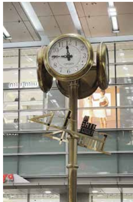
☆JR名古屋駅の金時計

名鉄電車は中央改札を出て左手に、JRは金時計のあるコンコースをぬけて、ロータリーを右手に進み、横断歩道を渡ってください。途中道案内が立っています。会場のウインクあいち、8階受付にてお待ちしております。